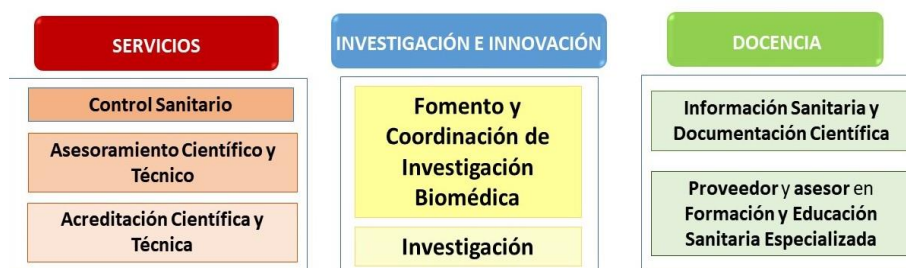
FIGURA 1. FUNCIONES DEL ISCIII

RD 375/2001, de 6 de Abril. Estatuto del Instituto de Salud "Carlos III" BOE-A-2001-8157, Artículo 4